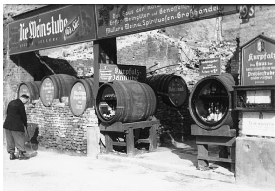
Provizorní vinárna v berlínských ruinách po druhé světové válce, přesné datum neznámé

Na konci čtyřicátých let 20. století začal v západní části Německa dynamický hospodářský rozvoj, krátce přerušovaný až v letech 1965–66 hospodářským poklesem , který vydržel až do ropné krize v roce 1973.