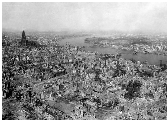
Kolín nad Rýnem, rok 1945

Německý hospodářský zázrak (něm. Wirtschaftswunder ) se říká období rychlého a neočekávaně dlouhodobého hospodářského rozvoje Německé spolkové republiky po druhé světové válce. Za počátek hospodářského zázraku se považuje měnová reforma v roce 1948. Jeho konec se někdy datuje do let 1957–8, kdy skončila konjunktura a také se završila předběžná integrace Spolkové republiky do světového hospodářství plnou konvertibilitou německé marky a založením EHS. Jindy se za konec zázraku považují léta 1966–7, kdy nastala první hlubší recese od konce druhé světové války. [1]