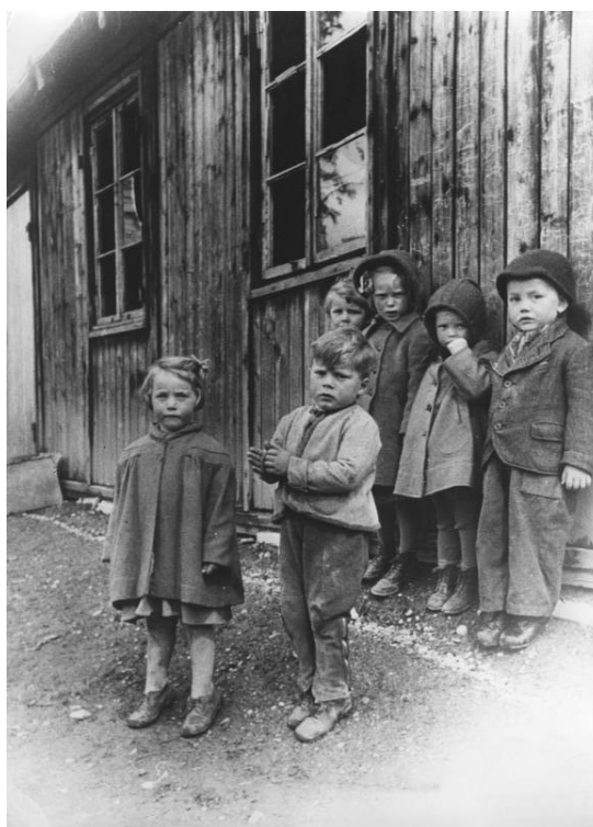
Německé děti v utečeneckém táboře po 2. světové válce, Západní Německo

a železnice byly těžce poškozeny pouze místy a četná přerušení kvůli zničeným mostům a dopravním uzlům mohla být relativně rychle opravena. Totéž platilo pro vodní cesty nesjízdné kvůli zničeným mostům. Vcelku rychlá obnova dopravní sítě tedy začala již před měnovou reformou v roce 1948; rychlý byl i pokrok v úklidových pracích sutin, které ve městech zanechala druhá světová válka.