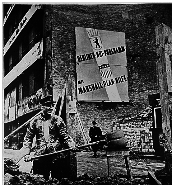
Západní Berlín, Marshallův plán

Finanční prostředky, které koncem roku 1947 přinesl Marshallův plán, byly z větší části půjčkami a jen z menší příspěvky. Důležitým faktorem bylo zvýšení vývozu, který byl z části dán velmi nízkými produkčními náklady v Německu, z části tzv. korejským boomem v USA v letech 1950 až 1951. Pevný kurs vůči americkému dolaru (4,20 německé marky za 1 americký dolar) fungoval jako nepřímá subvence vývozu. [3] Došlo rychlému k rozvoji německého vývozu – v roce 1960 byl 4,5 krát větší než v roce 1950. Také hrubý národní produkt se zvýšil třikrát. [4] Majetek podniků se začal zvyšovat, investice rostly. Německý podíl na světovém vývozu stoupl ze šesti na deset procent. Německý průmysl po korejském boomu získal náskok v nákladech a tudíž i v cenách. Německo využilo evropský nedostatek dolarů a předností Evropské platební unie. Německý průmysl mohl znovu začít vyrábět moderní investiční celky a strojírenské výrobky, rozjela se výroba aut, jakož i moderních elektrospotřebičů.