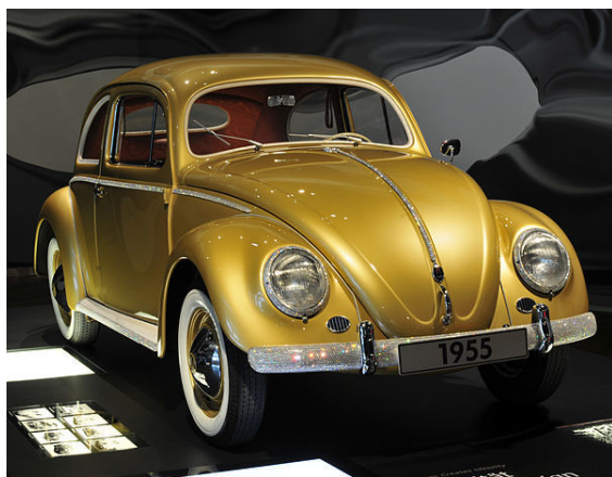
Miliónový Volkswagen Brouk byl vyroben dne 5. srpna 1955. Tento automobil byl populárním německým vývozním artiklem a symbolem německého hospodářského zázraku

Investice v NSR stouply mezi lety 1952 až 1960 o 120 procent, hrubý národní produkt stoupl o 80 procent. Německá politika odčinění nebyla jen cestou navrácení Německa do společenství národů, ale umožnila uzavřít v roce 1953 smlouvu o vyrovnání dluhů, kterou v Londýně dojednal bankéřem Hermannem Josefem Abs. Bylo to dlouhodobé, pro Německo vcelku velkorysé ujednání o starých dlužích, které byly sníženy přibližně na polovinu. V roce 1954 dosáhl počet bytů v Německé spolkové republice úroveň posledního mírového roku 1938. Tempo obnovy předčilo všechna očekávání; poválečné odhady odborníků se pohybovaly mezi 40 až 50 lety.