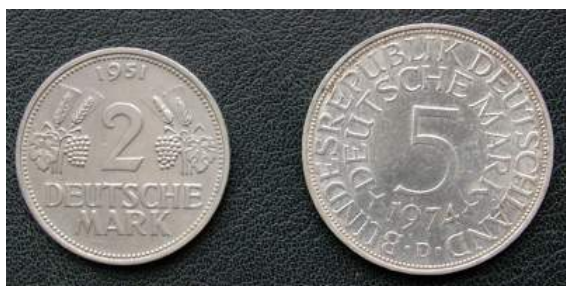
Předpokladem německého hospodářského zázraku bylo zavedení německé marky

Výchozí situace Německa po bezpodmínečné kapitulaaci v roce 1945 byla špatná. Na rozdíl od obytné kapacity velkoměst však zůstalo 80 až 85 procent produkčních kapacit na území pozdější Německé spolkové republiky neporušeno, a celková produkční kapacita byla dokonce větší než v posledním mírovém roce 1938. [2] Také silnice