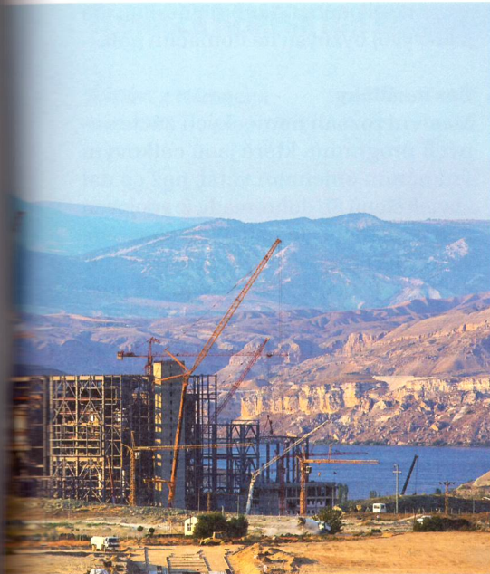
Turecká elektrárna Adularya se měla stát cennou referenční stavbou, ale místo toho přivedla strojírný Vítkovice k bankrotu.

vinu a vytasil se s odborným posudkem, podle kterého je vina na straně tureckého investora – holdingu Naksan. Ten prý na počátku slíbil kvalitnější uhlí, než reálně do elektrárny dodával. Problém měl být způsoben mimo jiné zvýšeným obsahem chloru v palivu. I když je to evidentní nesmysl (chlor může způsobit tak maximálně rychlejší korozi kotle), mnozí se nechali nachytat.