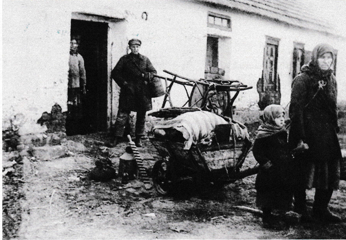
Do roku 1932 už kolchozy pohltily tři ze čtyř hospodářství. Útěk do měst sliboval obživu i větší bezpečí anonymity.

dluhy. A tak ve dvaatřicátém patřily již tři ze čtyř zemědělských hospodářství do kolchozů. Kdo mohl, utekl do města. Režim zdánlivě zvířel, ale triumf vrhal dlouhý stín.