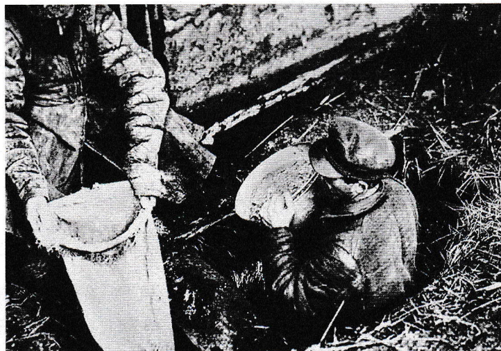
Ozbrojenci i dělnické úderky pátrali po ukrytém obilí

tvořili „kolchozy“, tedy kolektivní hospodářství. Organizacím tohoto druhu, přezdívaným „pevnosti socialismu“, měli postoupit svoji půdu, zvířata i mrtvý inventář a pracovat spolu s ostatními rolníky za plat - stejně jako státní zaměstnanci.