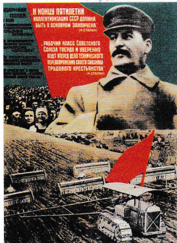
Stalinovi nešlo o pětiletku, ale ovládnutí nezávislých rolníků

S těmito nájezdíky přicházeli také agitátoři. Ti verbovali hlavně chudé venkovany, aby společně vy-