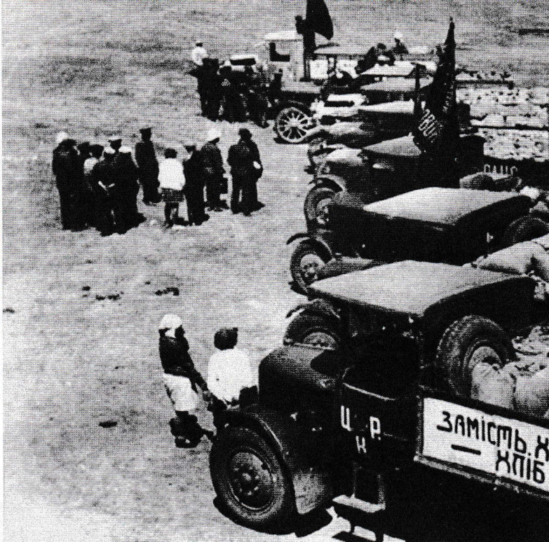
Když chybí zkonfiskované osivo, tak nepomůže ani mechanizace. Většinou pocházela z USA nebo se vyráběla podle amerických vzorů.

Kromě lidí došlo i na všechno to, co připomínalo staré časy. Komunisté a jejich přísluhovači str-