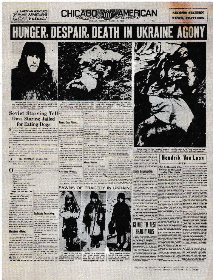
Realita daleko překonala hrůzy, které v západním tisku působily přehnané