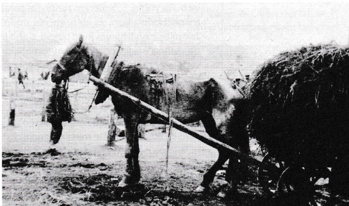
Než aby zvířata odevzdali, rolníci je raději vybjeli

Země zatím hledala novou ekonomickou rovnováhu. Přes všechna principiální omezení se zdálo, že jí NEP umožní chytit druhý dech. Připomeňme, že v roce 1926 žilo takřka 80 procent ze 147 miliónů sovětských občanů na vesnici. Většina rolníků si mohla dovolit nanejvýš