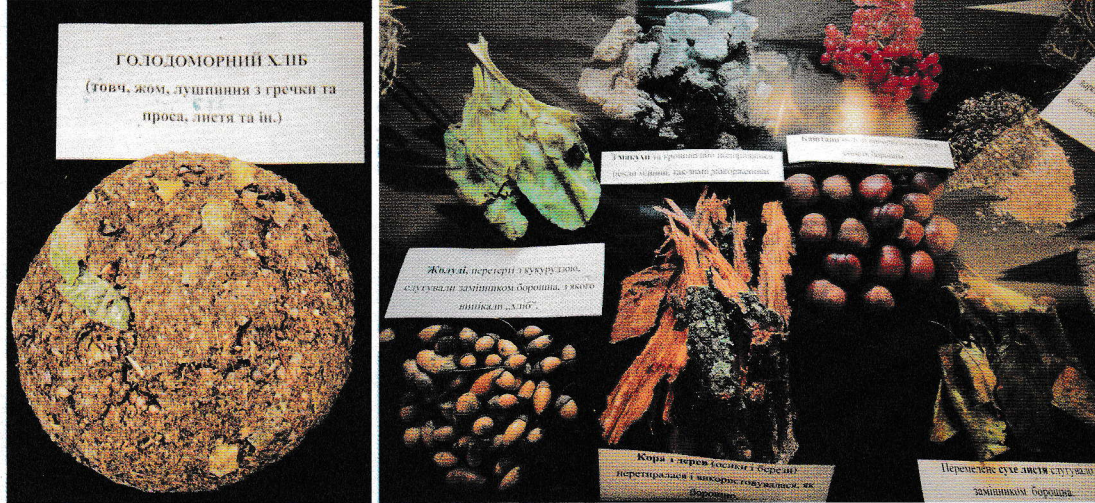
Exponáty náhražkových potravin ze starší výstavy o ukrajinském „holodomoru“: chléb z plev a listů, bobule, oříšky, ale i kůra a různé odpadky

Během posledního velkého hladomoru na území Evropy přišlo o život pět až šest milionů lidí, podle posledních poznatků se zdá, že na Ukrajinu připadá asi 3,9 miliónu obětí „holodomoru“, jak mu místní říkali. Bývalá obilnice Evropy navíc přišla asi o 6,1 miliónu nenarozených dětí.