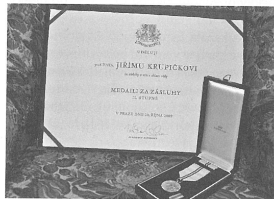
Medaile Za zásluhy II. stupně udělená prezidentem Václavem Klausem 28. října 2009