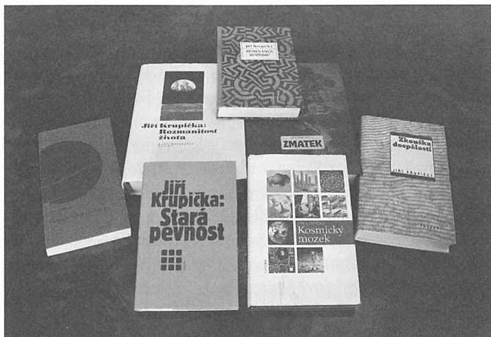
V letech 1994 až 2008 vyšlo Jiřímu v pražských nakladatelstvích sedm knih. Také publikoval statě a úvahy v Literárních novinách .