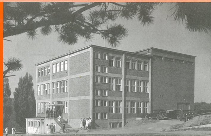
ZLÍNSKÝ FILMOVÝ ATELIÉR NEBOLI KUDLOVSKÁ STODOLA V ROCE 1936 / ZLÍN FILM STUDIO OR KUDLOV BARN, 1936