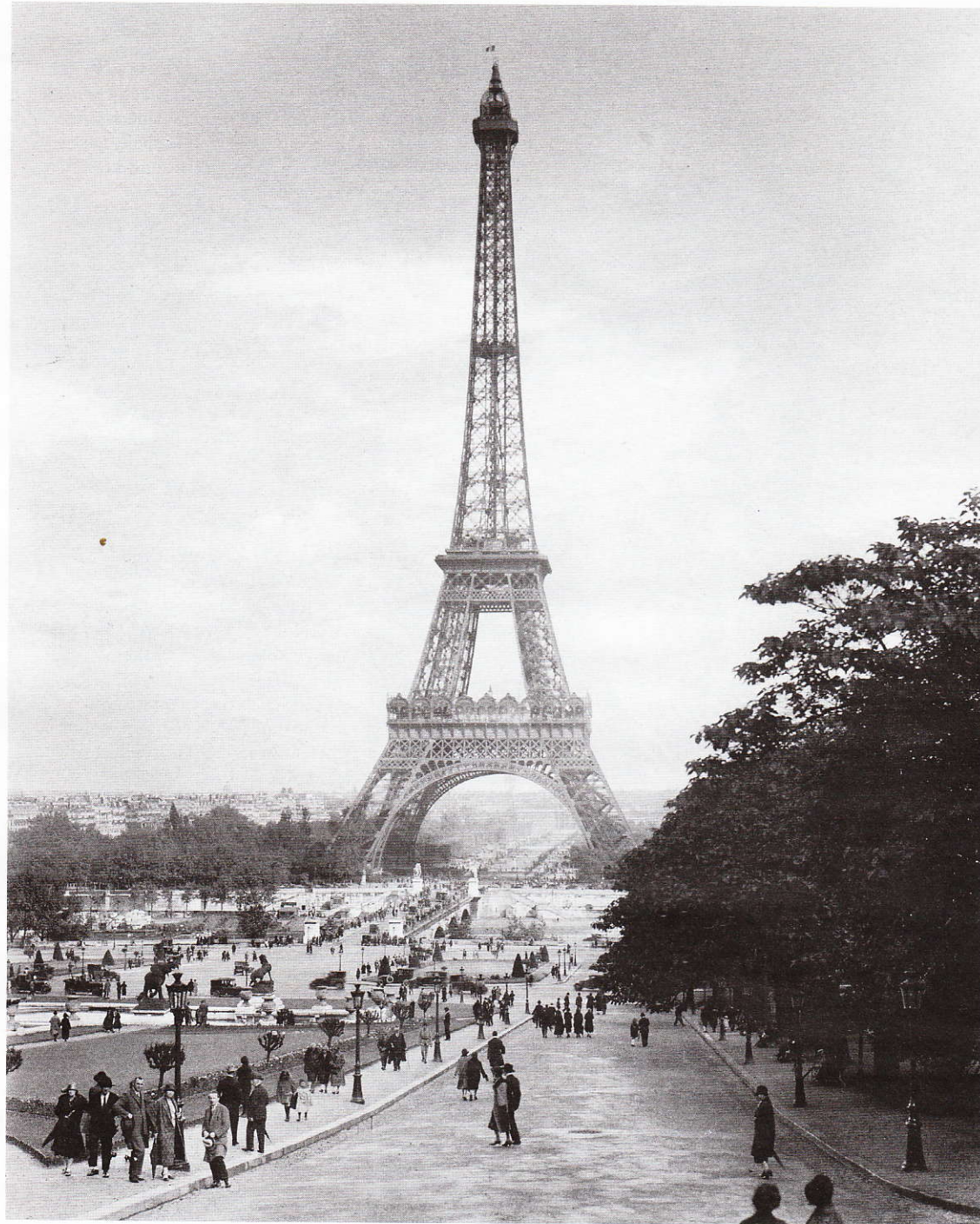
Viktor Lustig v roce 1925 „prodal“ fiktivně pařížskou Eiffelovku