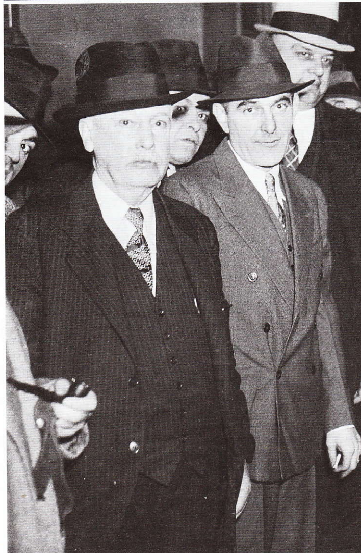
Jedno z mnoha zatčení Viktora Lustiga