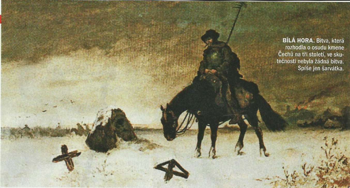
BÍLÁ HORA. Bitva, která rozhodla o osudu kmene Čechů na tři století, ve skutečnosti nebyla žádná bitva. Spíše jen šarvátká.

nešvary v církvi a skončil za to na kostnické hranici, nic společného. Jan Hus byl malý, holohlavý a tlustoučký. Nebyl to asketa ani fanatik. Trápily ho pochybnosti, strachy, nejistota. Muže pevného jako kámen z něho vytesal až František Palacký, možná nejvýznamnější postava českých dějin 19. století. Obrozeneckého století. Století, které zrodilo více historických lží než kterákoli jiná epocha.