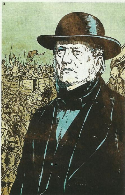
▲ FRANTIŠEK PALACKÝ. Otec českého dějepiscetví čas od času podřídil historická fakta svým osobním sympatiím a antipatiím. A nakazil jimi celý národ.

cestu přes vypuštěný rybník a zapadli do bahna, se změnil ve slavnou bitvou u Sudoměře. Zveličování, přehánění, manipulace. Takový byl Palackého přístup k nešťastné éře, jež české země vytrhla z evropského kontextu a kulturně i ekonomicky je vrhla o desítky let zpátky. Velmoc, kterou se Čechy během vlády velkých Lucemburků staly, se kvůli husitům změnila v divokou zemi nikoho. Přestalo platit právo, docházelo k ničení kulturních statků nezměrné hodnoty. Přesto ji Palacký a po něm další historici i političtí propagandisté vydávali (a občas stále vydávají) za vrchol našich dějin.