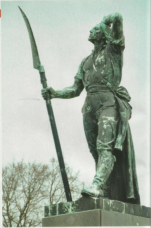
▲ SEDLÁK U CHLUMCE. Bitva mezi vojáky a zemědělci spočívala v tom, že první nahnali ty druhé do rybníka.

němu stala symbolem národního úpadku, útlaku a ponížení. Co bylo pro Napoleona Waterloo, to je pro kmen Čechů střet mezi jednotkami vzbouřených českých stavů a Ferdinanda Habsburského, k němuž došlo 8. listopadu 1620. Příběh má ale několik zádrhelů.