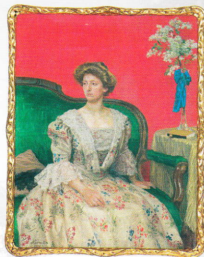
Portrét baronky Sidonie Nádherné z Borutína, Max Švabinský (1873–1962) 1908, olej na plátně, 74 × 58,1 cm