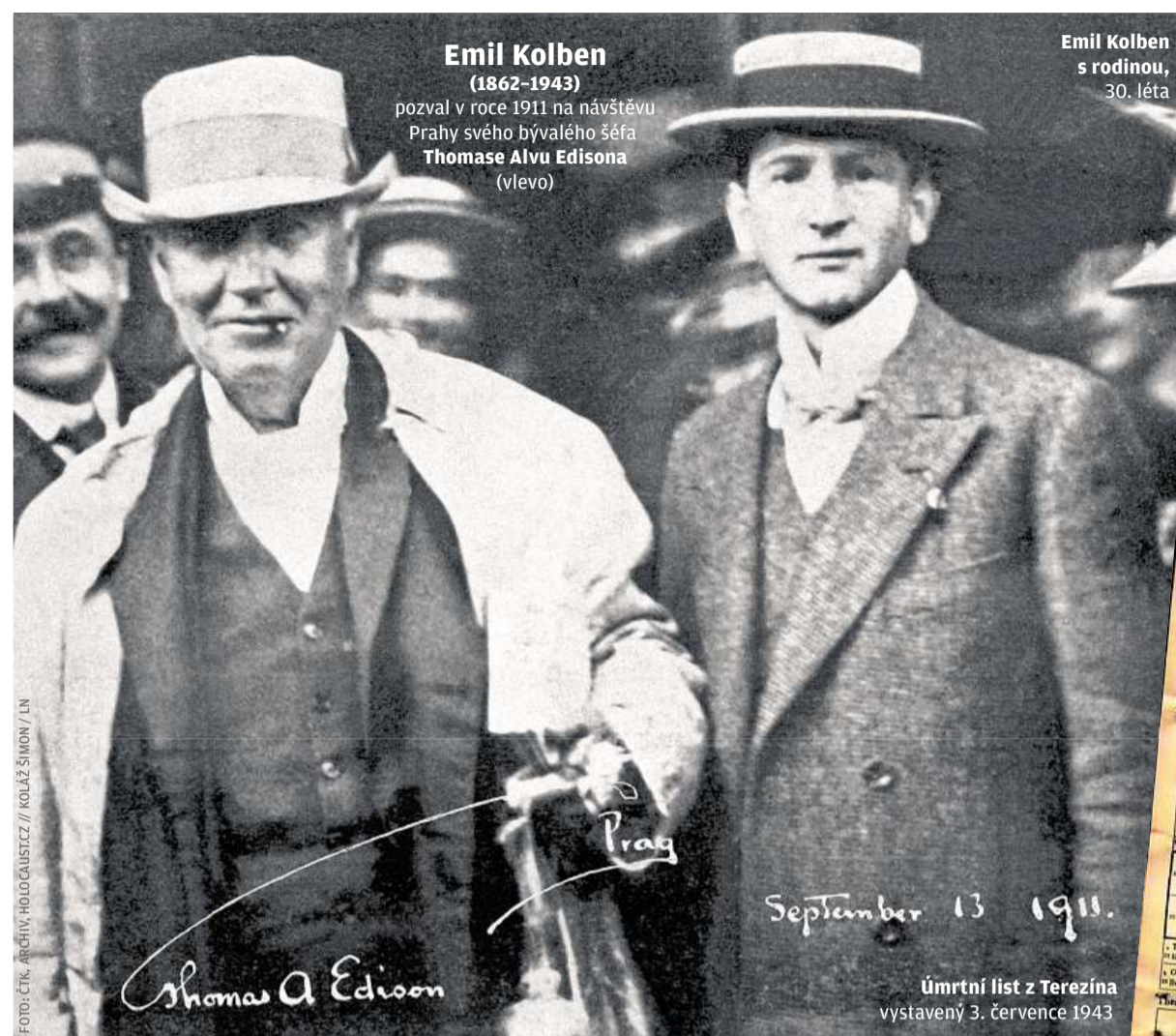
Emil Kolben (1862–1943)

Téhož dne nějakých třicet kilometrů na jih, ve Strančicích u Pra-